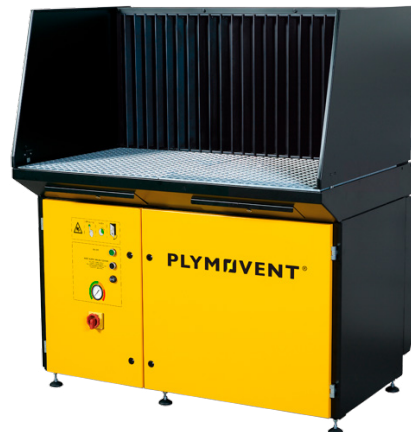
Bilden visar utsugsbord med utsugspanel och sidoplåtar.

DraftMax Ultra är ett arbetsbord som används för utsug och filtrering vid svets- och slipapplikationer. DraftMax Ultra består av arbetsgaller, trestegs förfiltrering för optimal gnistfångning och två självrensande filterpatroner. Under både förfilter och filterpatroner finns det utdragbara stoftlådor. Filterrensningen startar automatiskt när undertrycket över filterpatronerna når maxvärdet då enheten är i drift (online rensning). Filterpatronerna rensas var för sig genom tryckpulser. Ett inbyggt ljudalarm indikerar när filterbyte krävs. Vid svets- och slipapplikationer bör DraftMax Ultra kompletteras med en bakre utsugspanel för optimal fördelning av utsugskapaciteten (ca. 80% bakåt, 20% neråt). Utsugsbordet kan, beroende på applikation, utrustas med anpassade arbetsgaller. Arbetshöjden på utsugsbordet kan justeras. Filterbyte och service utförs enkelt framifrån (med undantag av membranventiler).