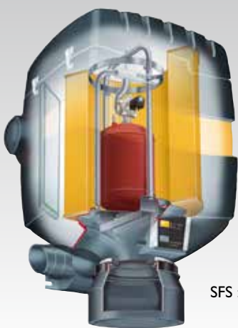
SFS : RoboClean® systeem

De SFS heeft het RoboClean® systeem en een 30 m 2 groot filter, behandeld met SurfacePlus®. Dit garandeert dat de SFS een heel speciale positie inneemt op de markt voor zelfreinigende filters. De automatisch geïnitieerde krachtige en diep werkende luchtstoot werkt door tot in iedere filtersectie. Dit heeft het voordeel van langere intervallen tussen de pulsen met als eindresultaat lagere energiekosten voor de klant en, voor de lasser, een constantere zuigkracht. Het residu wordt in een container verzameld en is dus eenvoudig te verwijderen. Geen ander apparaat op de markt is in prijs en prestatie vergelijkbaar met de stationaire Plymovent SFS lasrookfilter.