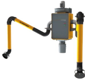
WallPro Double con brazos de aspiración montados directamente (DM)