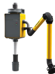
Opción: juego de extensión del depósito de polvo

* Pida a su representante de ventas la lista completa de configuraciones..