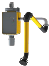
WallPro Single con brazo de aspiración montado externamente (EM)