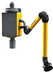
WallPro Single con brazo de aspiración montado directamente (DM)