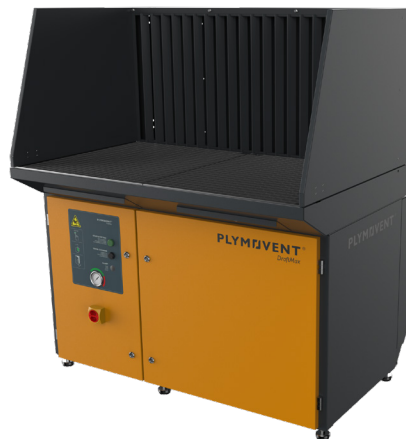
Ejemplo: mesa de aspiración descendente con kit de aspiración trasera y paneles laterales

DraftMax Ultra es un banco de trabajo que proporciona aspiración y filtración en aplicaciones de soldadura y amolado. La mesa de aspiración DraftMax Ultra dispone de una rejilla de trabajo, un sistema de prefiltración en tres etapas para retener las chispas de una forma eficaz y dos cartuchos de filtro principales autolimpiables. Debajo de los prefiltros antichispas, y debajo de los cartuchos filtrantes, se encuentran dos gavetas para recogida de polvo extraíbles. El sistema de limpieza del filtro se activa automáticamente cuando el límite de presión mínima ha llegado a un determinado valor durante el uso (limpieza durante el funcionamiento). Los cartuchos filtrantes se limpian individualmente desde su interior mediante disparos de aire comprimido. Un zumbador integrado indica cuándo es necesario cambiar los cartuchos filtrantes. Para aplicaciones de soldadura y amolado, debe acoplarse un kit de aspiración trasera para obtener una óptima división de la capacidad de aspiración (aprox. 80% de aspiración trasera y 20% en el plano horizontal). Según la aplicación específica, la mesa de aspiración descendente puede disponer de una rejilla de trabajo especial. La altura de trabajo de la mesa es ajustable. El recambio de los filtros y el mantenimiento (excepto de las válvulas de diafragma) se realizan desde el panel frontal.