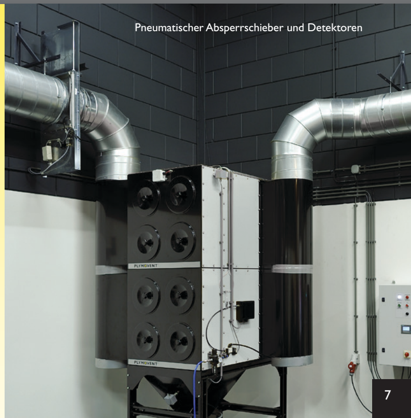
Pneumatischer Absperrschieber und Detektoren